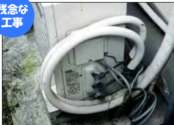
余分な配管をカットせず後ろで巻いている。